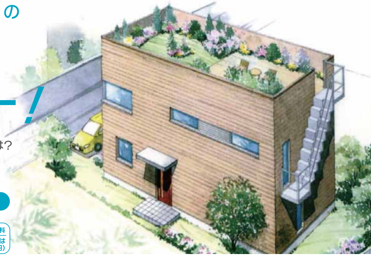
illust: 鎌倉パッシブハウス

とき 3/10 SAT 13:00 開場 13:30 開始 定員制限あり 一般の方は無料 建築関係者は有料(2,000円) 完全予約制